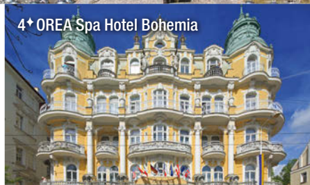
4★ OREA Spa Hotel Bohemia

Verpflegung: Das ausgezeichnete Hotelrestaurant verwöhnt Sie mit einer großen Auswahl an Spezialitäten der böhmischen und internationalen Küche. Morgens und abends bedienen Sie sich vom reichhaltigen Büfett.