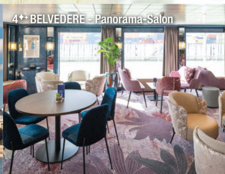
4++ BELVEDERE - Panorama-Salon