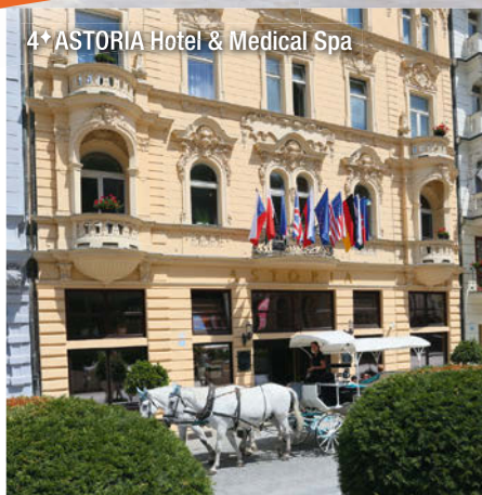
4★ ASTORIA Hotel & Medical Spa

Im gemütlichen Teeraum stehen Ihnen täglich von 08:00 Uhr bis 20:00 Uhr kostenlos verschiedene Tee-Sorten zur Verfügung.