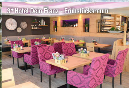
3+ Hotel Dein Franz - Frühstücksraum