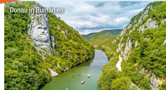
Donau in Rumänien