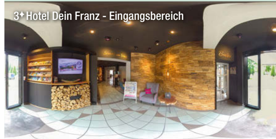
3+ Hotel Dein Franz - Eingangsbereich