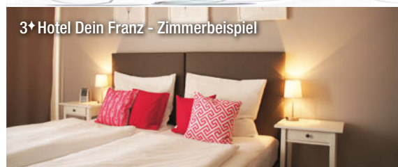
3+ Hotel Dein Franz - Zimmerbeispiel