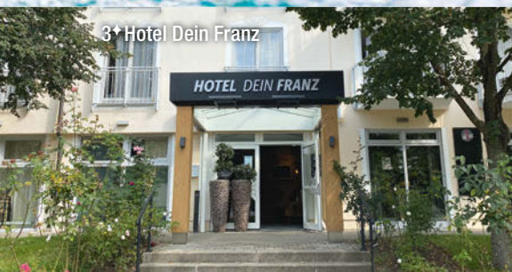
3+ Hotel Dein Franz

2x Eintritt in die THERME EINS pro Woche inklusive!