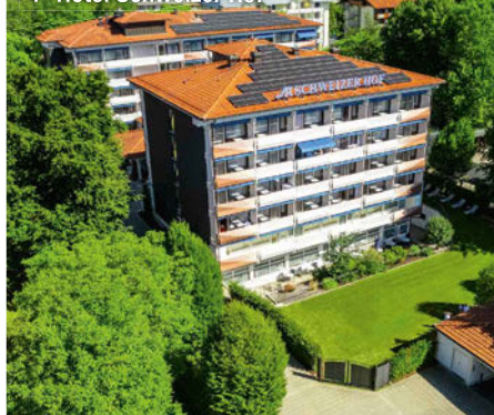
4+ Hotel Schweizer Hof

Freizeit/Kur/Unterhaltung: Genießen Sie die Kraft des heilenden Thermalmineralwassers im hauseigenen Thermal-Innenbecken (10 x 12 m, ca. 37°C) mit Hot-Whirlpool sowie im beheizten Thermal-Außenbecken (ca. 50 m², 28°C, witterungsbedingt von Mai-Oktober). Oder entspannen Sie in der Saunalandschaft mit finnischer und Heusud-Sauna, Dampfbad, Blütenlaconium mit Farblicht- und Kräuterstimulation, Meeresklimakabine, „Raum der Sinne“ mit temperierten Wasserbetten, Kneippbecken, Erlebnisduschen, Thermal-Trinkbrunnen und vielem mehr. Zur Verbesserung Ihrer körperlichen Fitness erwartet Sie ein zertifizierter Trainer mit verschiedenen Sportangeboten.