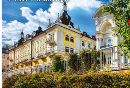
4♦ Resort Reitenberger

machten Kuchen und Desserts (gg. Aufpreis) oder lassen Sie den Abend in angenehmer Atmosphäre bei einem Glas Wein oder Cocktail (gg. Aufpreis) ausklingen.