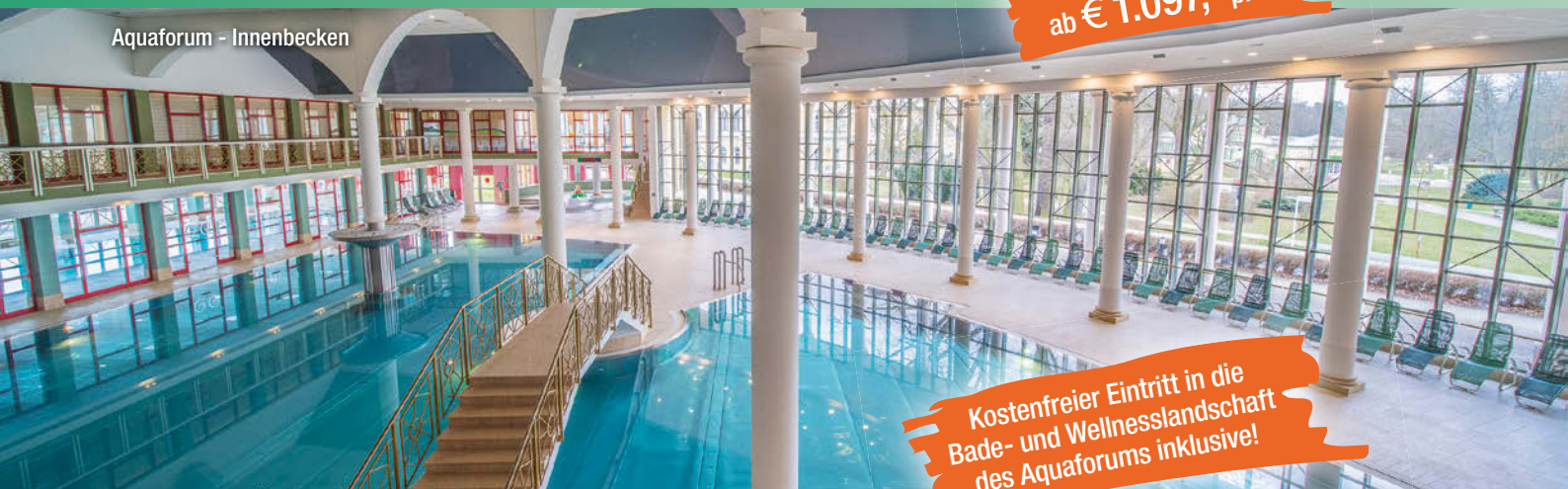
Aquaforum - Innenbecken

Kostenfreier Eintritt in die Bade- und Wellnesslandschaft des Aquaforums inklusive!