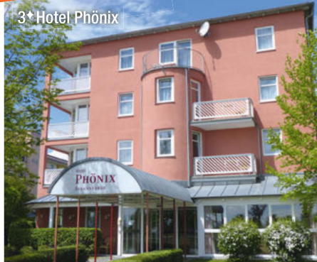
3+ Hotel Phönix

ser, Kaffee, Tee, Softdrinks, Bier und Hauswein) sind für Sie während des Abendessens bereits inklusive.