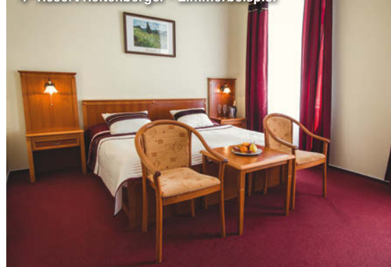
4♦ Resort Reitenberger - Zimmerbeispiel

➤ Verlängerung: Der Preis der Verlängerungswoche entspricht der jeweiligen Saisonzeit während des Aufenthalts.