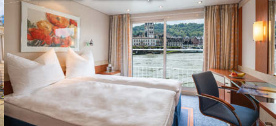
4++ BELVEDERE - Kabinenbeispiel